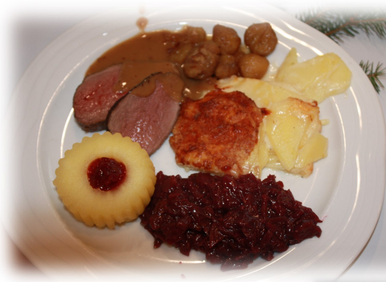
Hirschschnitzel, Rotkraut mit Marroni, dazu Kartoffelgratin und Preiselbeerapfel