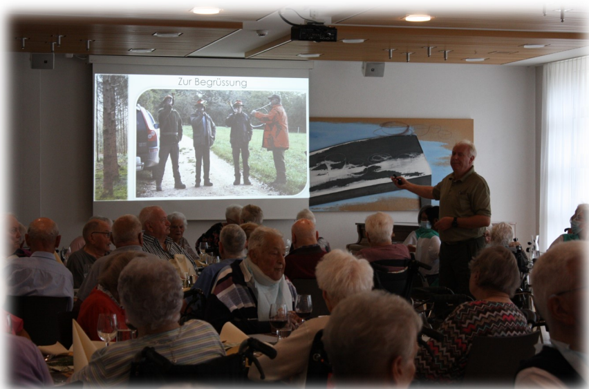
Gespannt lauschten unsere Bewohnenden dem Vortrag des Jägers