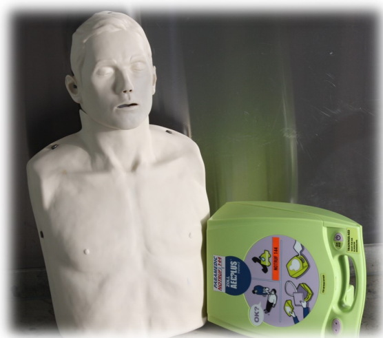
Schulungen zum Thema „richtiges Handeln bei Herzstillstand“ werden kontinuierlich für alle Mitarbeitenden angeboten

Expertin bringt den Pflegefachkräften die Thematik der modernen Wundversorgung chronischer Wunden näher