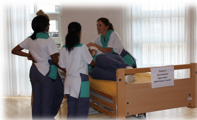
*Beim Erlernen der richtigen Handgriffe zur Mobilisation und dem Transfer eines Bewohners gibt es vieles zu beachten