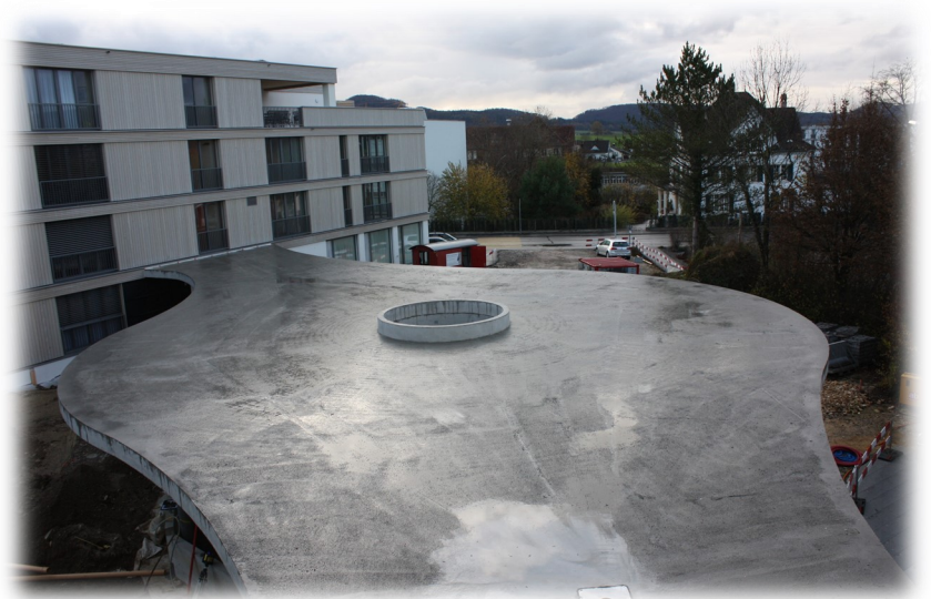
Überdachter Zugang JeKa Haus