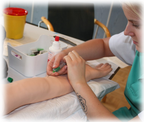
*Richtig Blutabnehmen will gelernt sein. Zur Übung werden im AZB u.a. künstliche Extremitäten verwendet